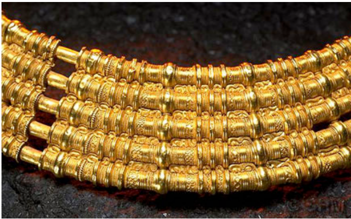
Den femringade halskragen från Färjestaden, Torshunda socken, Öland.

Statens historiska museer (SHMM) är en central museimyndighet som består av Historiska museet, Kungl. myntkabinettet och Tumba bruksmuseum. Myndigheten förvaltar kulturarv och ger perspektiv på tillvaron för att stärka en demokratisk samhällsutveckling. Vi arbetar nu med att förändra och utveckla verksamheten för att bli Nordens bästa kulturhistoriska museer.